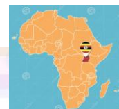
ST. JOSEPH'S HOSPITAL-KITGUM